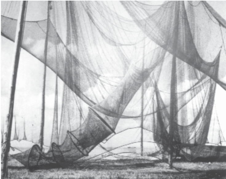
Bottengarn på tork.